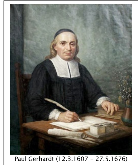
Paul Gerhardt (12.3.1607 – 27.5.1676)

Paul Gerhardt (* 12. März 1607 in Gräfenhainichen/Kurfürstentum Sachsen; † 27. Mai 1676 in Lübben [Spree-wald]); evangelisch-lutherischer Theologe, gilt neben Martin Luther als einer der bedeutendsten deutschsprachigen Kirchenlieddichter. 38